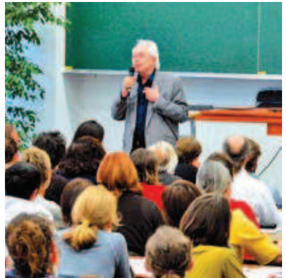
200 personnes, professionnels de la périnatalité et parents, étaient présentes lors de la conférence.