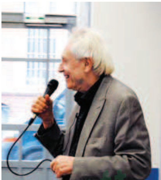
Michel Odent lors de sa conférence à la suite de l'interview.

Je suis toujours tenté de privilégier les livres les plus récents, ils sont à jour. Il se passe tellement de choses. Le livre La césarienne : Questions, effets, enjeux , relativement récent, oblige à parler de tout ce qui touche à la naissance et de ce qui permet d'éviter la césarienne, il n'est pas forcément pour les personnes qui s'y intéressent.