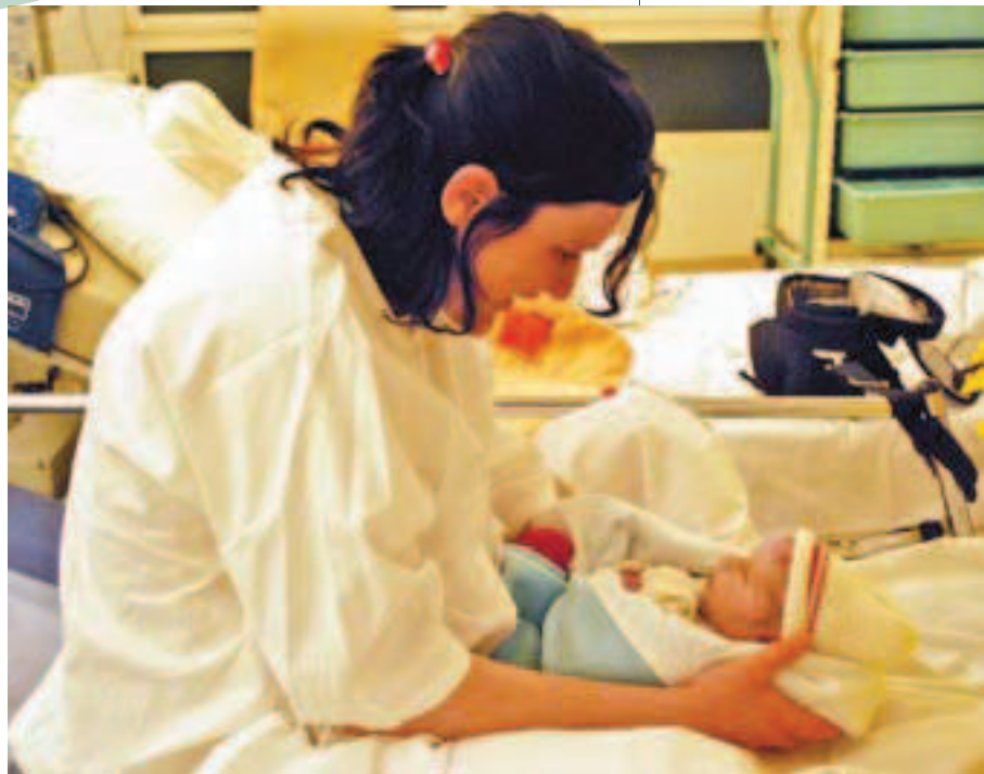
Un nouveau-né a besoin de sa mère.