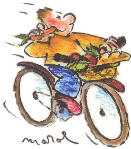
Illustration Marol, éditions Jouvence