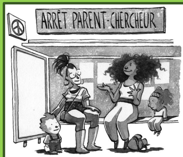
1Illustration Lilyan pour 'Montessori au coeur de la vie de famille' DUNOD 2018