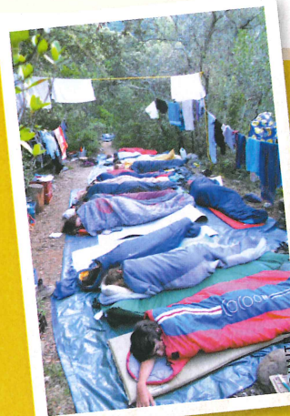
ASSO LE MAT - LE VIEL AUDON

6/9 ans, 9/13 ans, 12/15, 15/17 ans. aspre@wanadoo.fr, Tél. 06 11 62 60 52