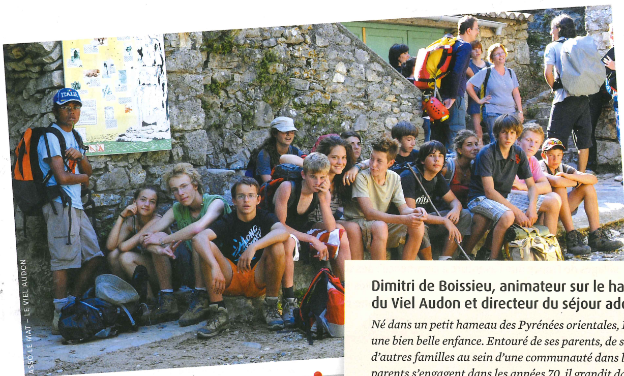
ASSO LE MAT - LE VIEL AUDON