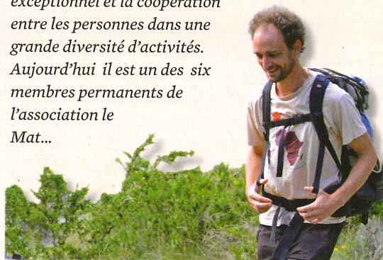
ASSO LE MAT - LE VIEL AUDON